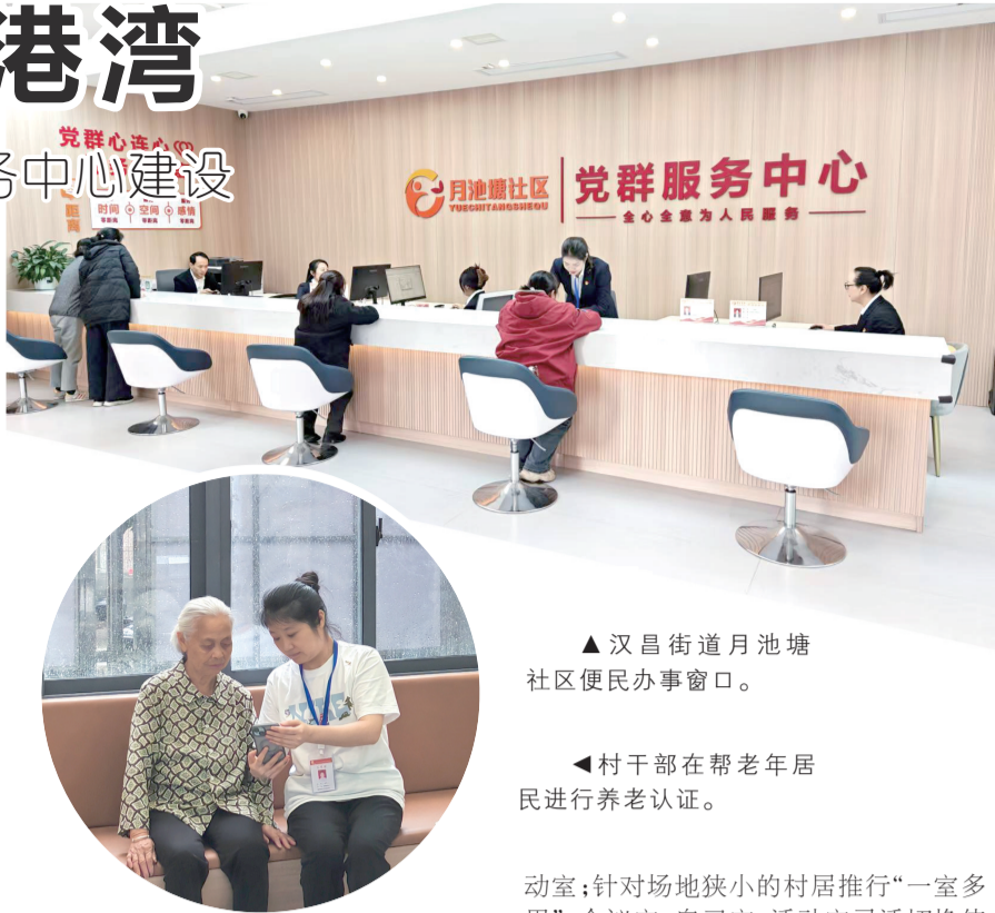
▲ 汉昌街道月池塘社区便民办事窗口。