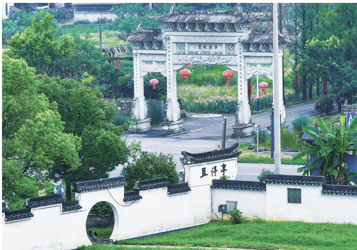
位于浙江省金华市兰溪市的且停亭。