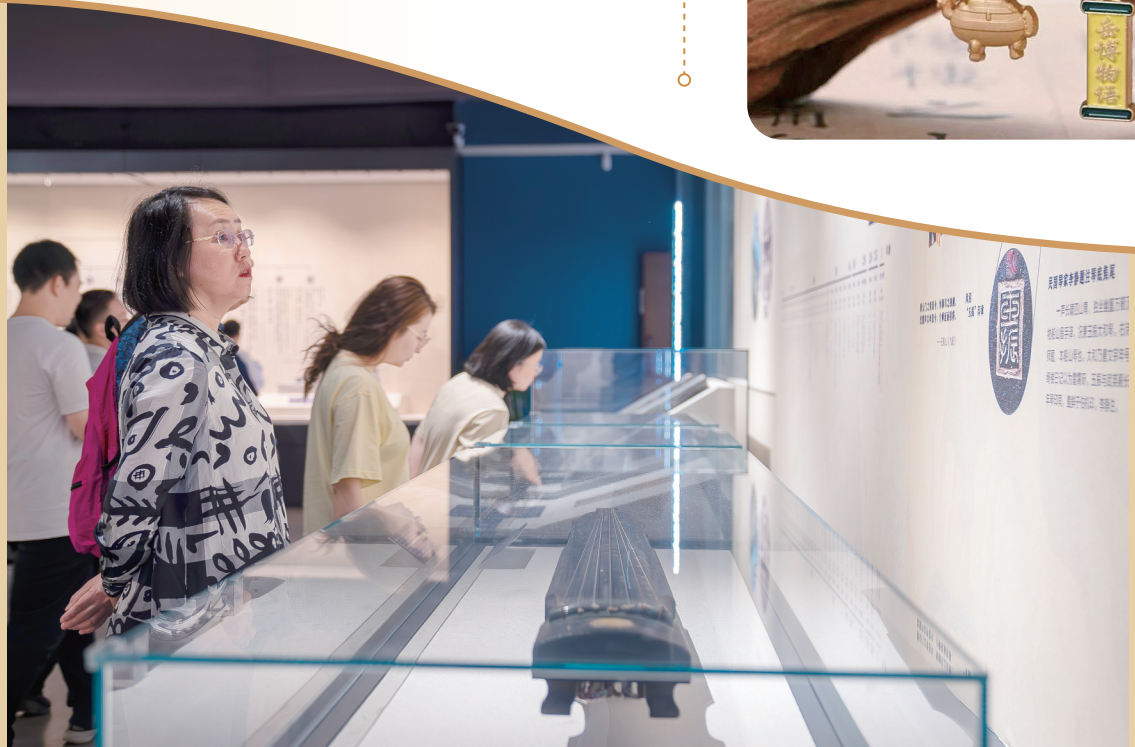
2025年5月4日，游客在衡阳市博物馆参观。

“接下来，我省将建成100家乡村文化空间与流动展览点，让中小型博物馆真正成为百姓身边的公共文化空间。”湖南省文旅厅党组成员、省文物局局长姜薇表示，未来，湖南将持续深化文博领域改革，进一步统筹整合全省资源，补齐基层短板，探索与更多国企、社会力量开展广泛合作，以机制创新推动文物保护成果全域覆盖、全民共享。