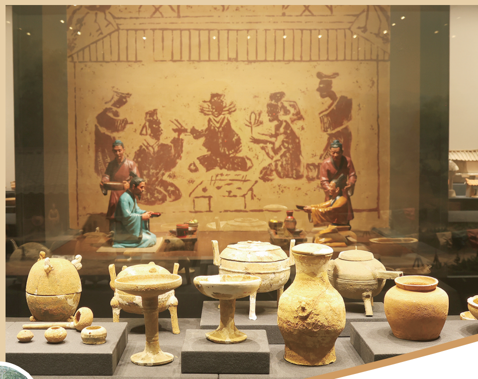
湖南省文物考古研究院调拨了湘乡虞塘出土的125件(套)文物给湘潭市博物馆。图为展出的部分文物。