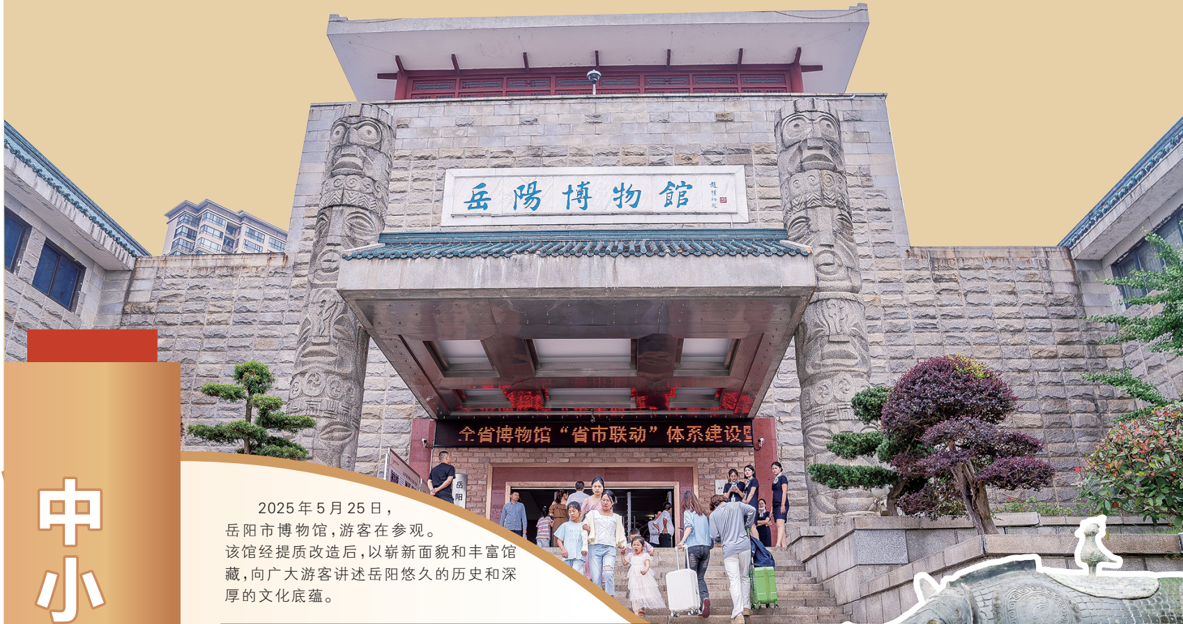
2025年5月25日，岳阳市博物馆，游客在参观。该馆经提质改造后，以崭新面貌和丰富馆藏，向广大游客讲述岳阳悠久的历史 and 深厚的文化底蕴。