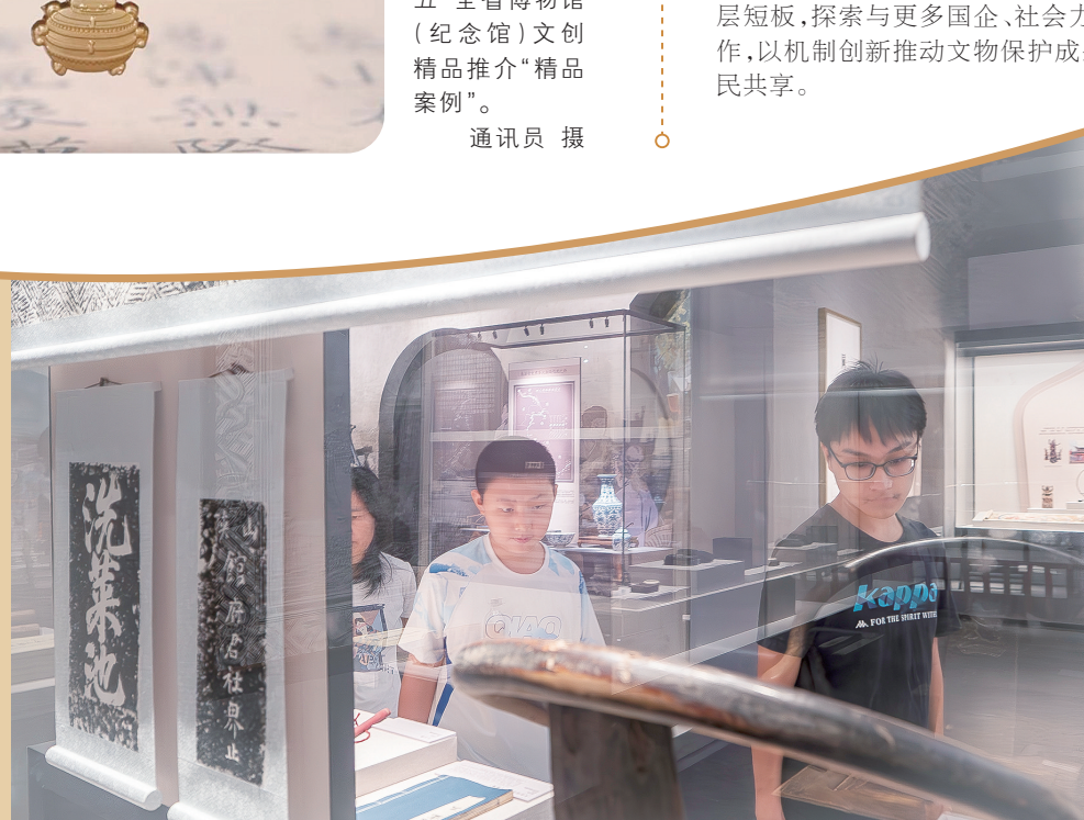
2025年9月13日，市民在怀化市博物馆新馆参观。9月12日，怀化市图书馆、怀化市博物馆新馆联合举行开馆仪式，以现代化、智慧化、沉浸式体验为核心，成为展示城市文化的新窗口。