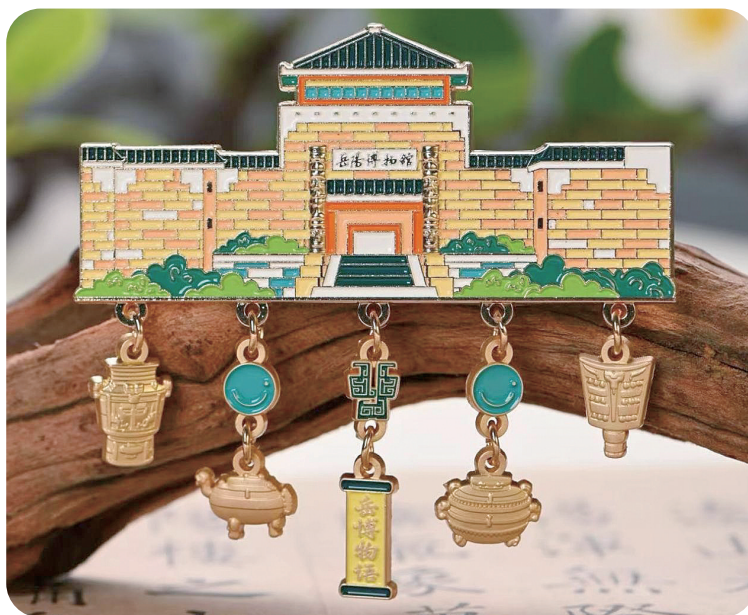
岳阳市博物馆“岳博物语”系列文创产品获评“十四五”全省博物馆(纪念馆)文创精品推介“精品案例”。

人员增编、中高级职称人员占比增加等人才政策的实施，让湘潭市博物馆原有的人才干劲十足，为馆里招来了展览策划、信息化、考古发掘等新人才。