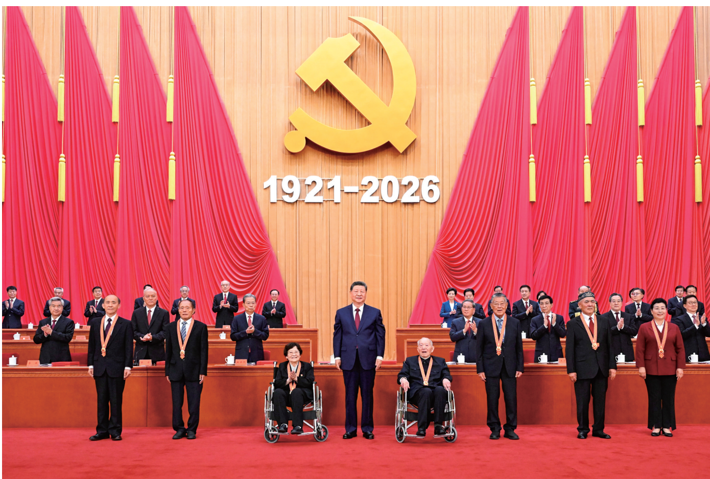
7月1日上午,庆祝中国共产党成立105周年大会在北京人民大会堂隆重举行。中共中央总书记、国家主席、中央军委主席习近平向“七一勋章”获得者颁授勋章。

新华社北京7月1日电 庆祝中国共产党成立105周年大会7月1日上午在北京人民大会堂隆重举行。中共中央总书记、国家主席、中央军委主席习近平向“七一勋章”获得者颁授勋章并发表重要讲话。他强调,105年来,我们党始终坚守为中国人民谋幸福、为中华民族谋复兴的初心使命,在不懈奋斗中创造了彪炳史册的伟大成就。新征程上,全党同志要坚定信心、接续奋斗,不断创造无愧于时代和人民的新业绩。