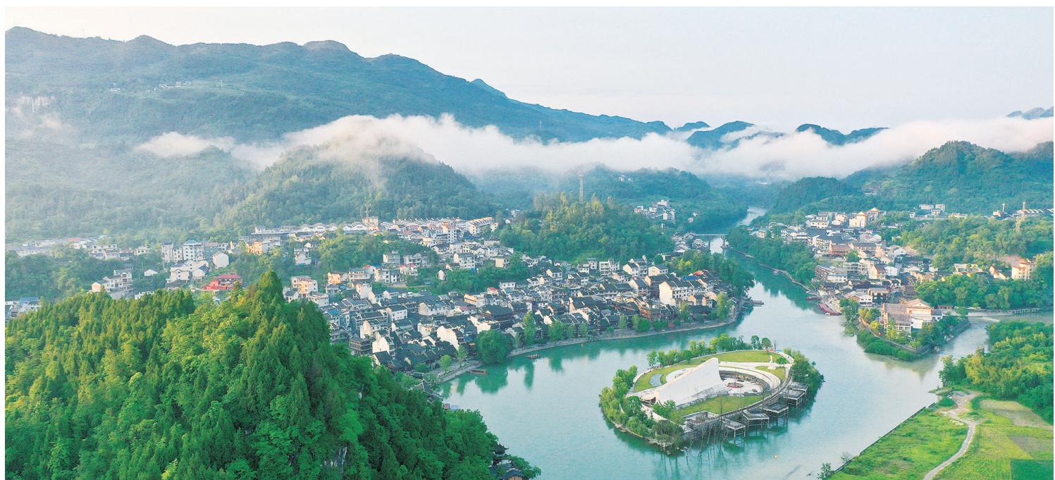
6月4日清晨,雨后的花垣县花垣镇吉响坪社区云雾缭绕,青山、民居、梯田在云海若隐若现,共同勾勒出一幅清丽秀美的苗乡画卷。

在靖州,杨梅是很多人一年的收成。把果子种好、采好、发出去,让吃的人说声“不错”——这是他们最朴素的愿望,也是他们一直在做的事。