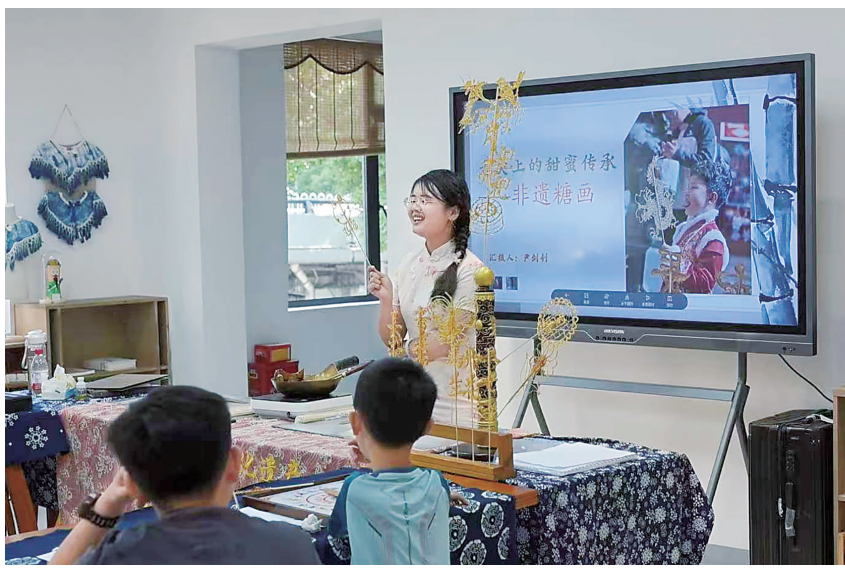
6月1日，长沙戏剧非遗展示中心，小朋友在参加非遗艺术课堂。

全新升级后的长沙戏剧非遗展示中心，实用面积超330平方米，立足公益普惠的公共服务定位，深挖湖湘文脉，打造小巧精致、烟火气与书卷气共生的城市