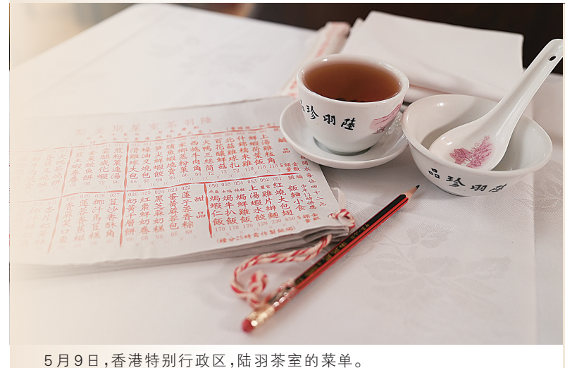
5月9日，香港特别行政区，陆羽茶室的菜单。