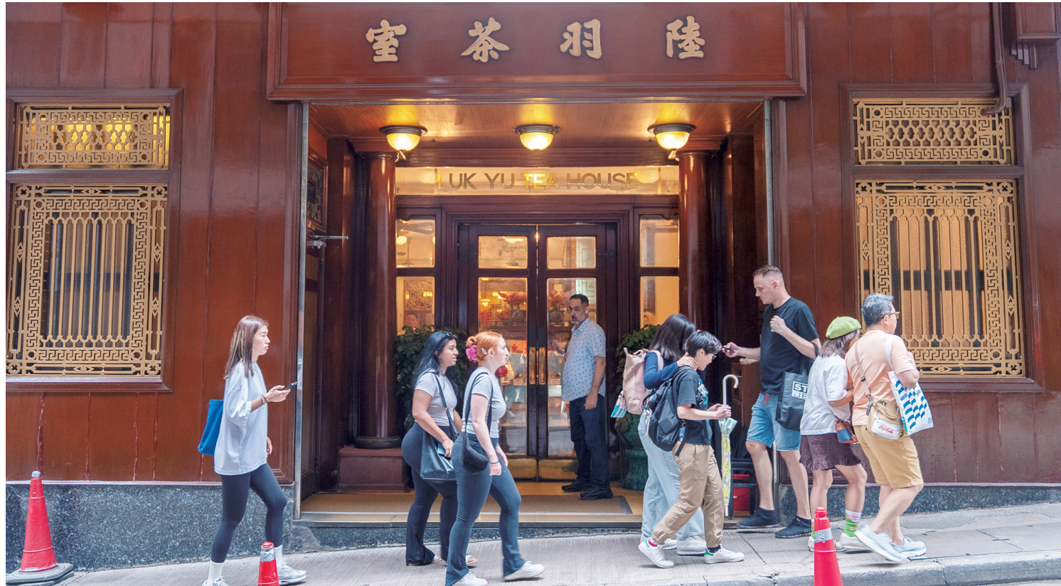
5月9日，香港特别行政区，有着90余年历史的陆羽茶室。