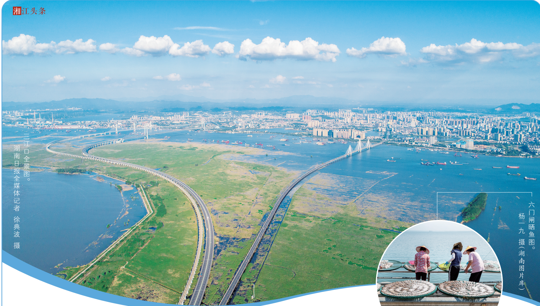
三江口全景图。