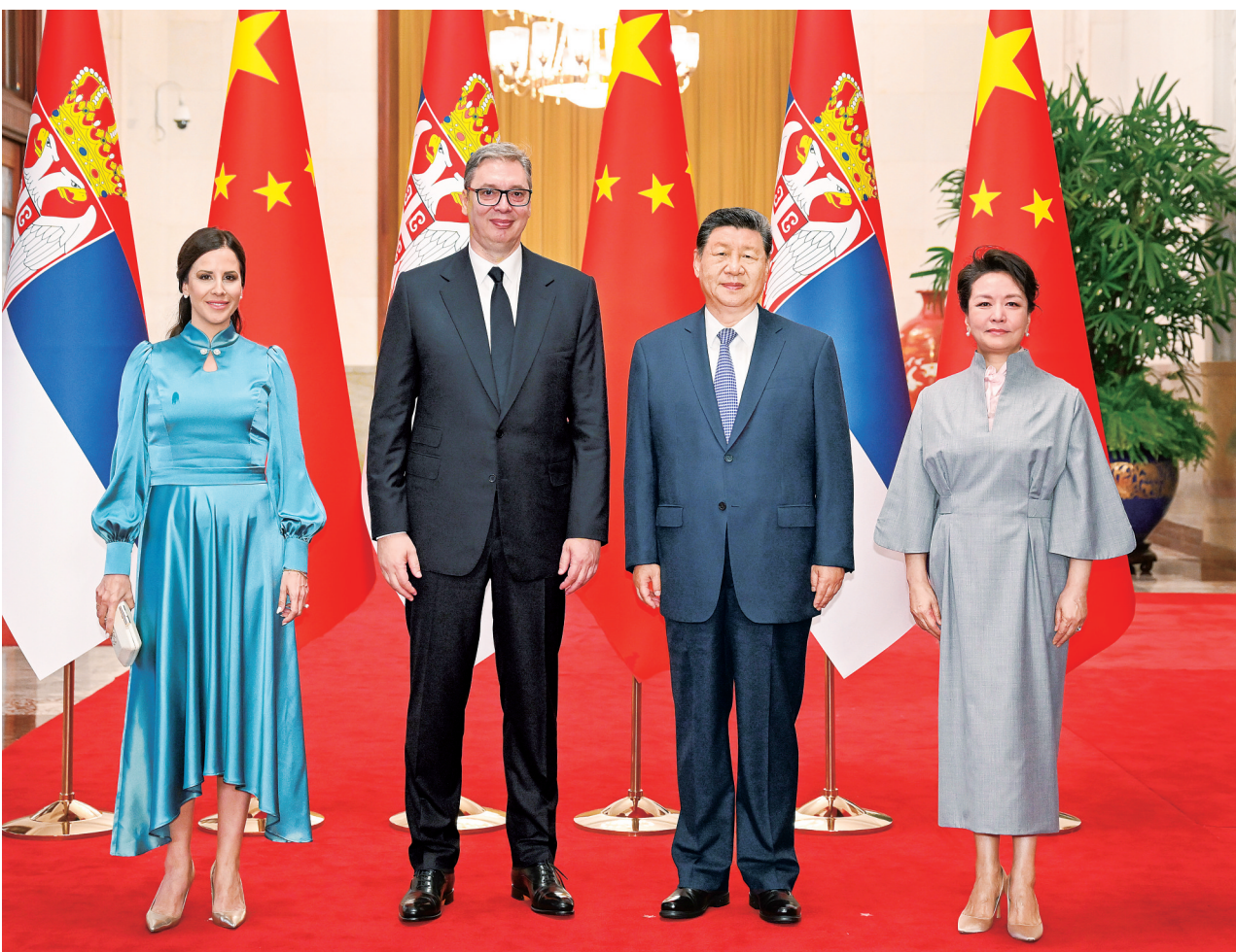
5月25日下午，国家主席习近平在北京人民大会堂同来华进行国事访问的塞尔维亚总统武契奇举行会谈。这是会谈前，习近平和夫人彭丽媛同武契奇和夫人塔玛拉合影。

新华社北京5月25日电(记者杨依军)5月25日下午，国家主席习近平在北京人民大会堂同来华进行国事访问的塞尔维亚总统武契奇举行会谈。