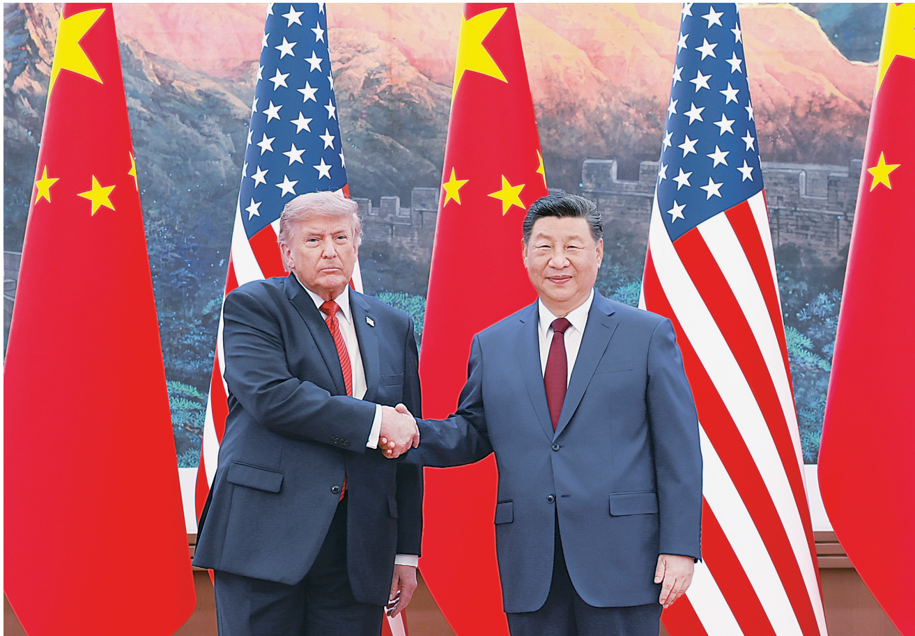
5月14日上午,国家主席习近平在北京人民大会堂同来华进行国事访问的美国总统特朗普举行会谈。