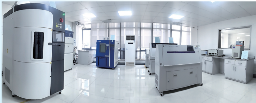
湘江涂料检测中心荣获CNAS国家认可。