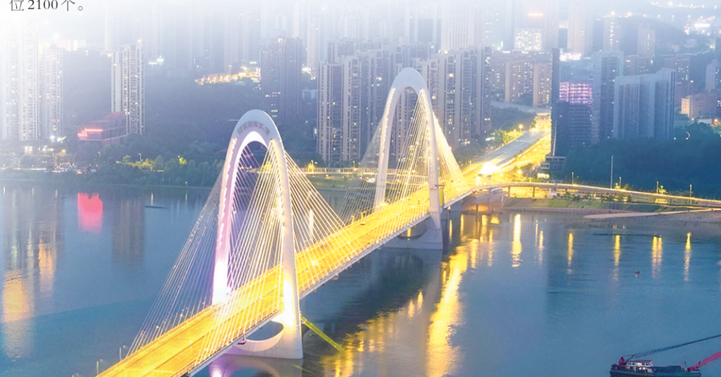
兴联路大桥防腐涂料应用。