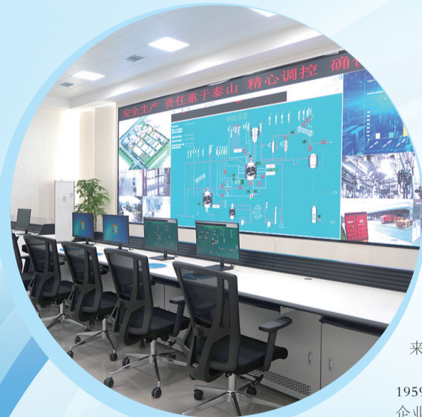
湘江涂料智能化生产控制中心操控室。

实干兴企,实业报国,实绩致远!湘江涂料,将继续以“实”字精神作答时代考卷,深耕涂料主业,强化科技创新,践行绿色发展,为湖南“三个高地”建设贡献更大力量,书写中国涂料工业高质量发展的崭新篇章!