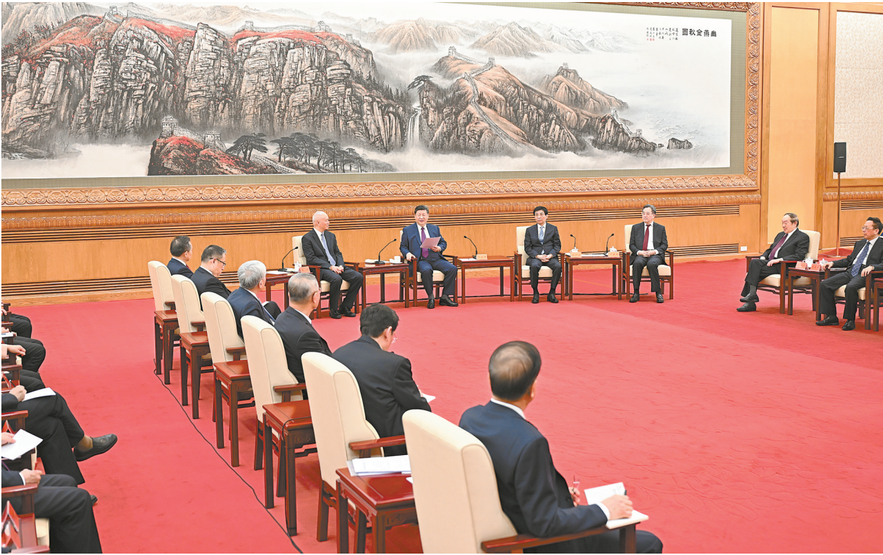
2月11日,习近平、王沪宁、蔡奇、丁薛祥等在北京人民大会堂同党外人士欢聚一堂,共迎佳节。

新华社北京2月11日电 在中华民族传统节日丙午马年春节即将到来之际,中共中央总书记、国家主席、中央军委主席习近平11日下午在人民大会堂同各民主党派中央、全国工商联负责人和无党派人士代表欢聚一堂,共迎新春。习近平代表中共中央,向各民主党派、工商联和无党派人士,向统一战线广大成员,致以诚挚问候和美好祝福。 中共中央政治局常委、全国政协主席王沪宁,中共中央政治局常委、中央办公厅主任蔡奇,中共中央政治局常委、国务院副总理丁薛祥出席。 民革中央主席郑建邦、民盟中央主席丁仲礼、民建中央常务副主席秦博勇、民进中央主席蔡达峰、农工党中央主席何维、致公党中央主席蒋作君、九三学社中央主席武维华、台盟中央主席苏辉、全国工商联主席高云龙和无党派人士代表周志和、王梅祥等应邀出席。应邀出席的还有全国政协副主席何厚铨、梁振英,已退出领导岗位的各民主