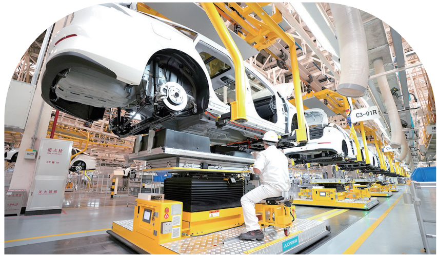
广汽埃安长沙工厂。