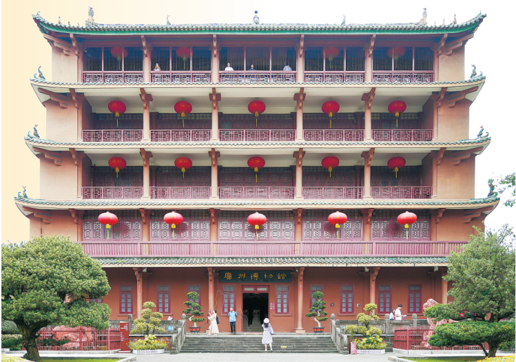
游客在镇海楼参观。