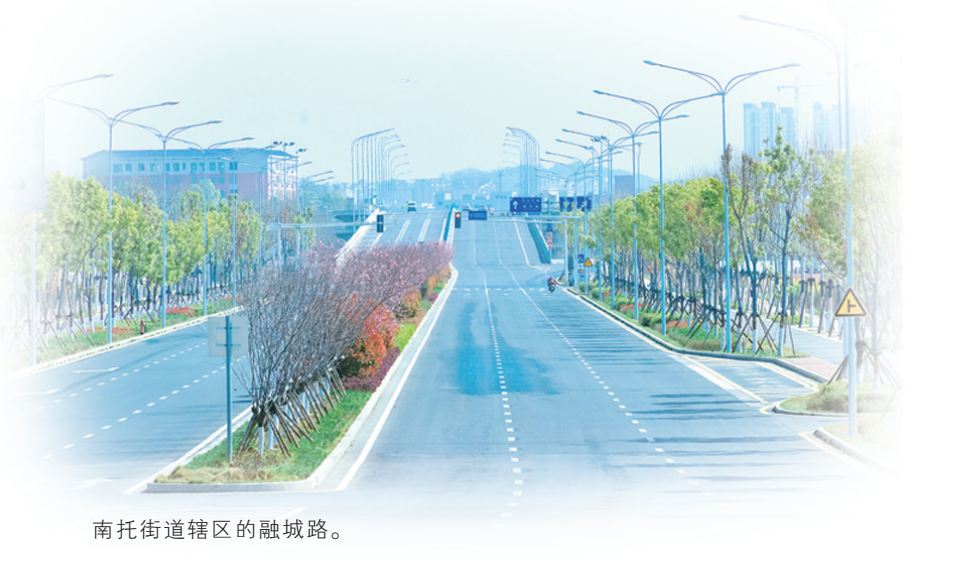
南托街道辖区的融城路。

这里曾是长株潭三市交界的“边陲之地”，如今一跃成为长沙向南发展的战略“桥头堡”。 在“十五五”开局之年，长沙市天心区南托街道正以其独特的区位优势与坚实的发展步伐，诠释着乡村振兴与城市能级提升的深度融合。 长株潭绿心之畔，湘江蜿蜒而过。 站在即将贯通的蓉坪湘江特大桥，目光所及，昔日的城郊乡镇轮廓正被现代化的建设场景快速重塑。 这里是长沙市天心区南托街道——一个总面积30.05平方公里的区域，农业区域面积占比约六成，拥有15442名农业人口和7801.2亩耕地。 它北承省会长沙主城区，西接湘潭，东连株洲，在长株潭都市圈国家战略的宏大版图上，精准落位于南部融城片区的核心。