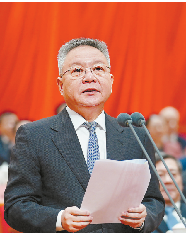
省委书记、省人大常委会主任、大会主席团常务主席沈晓明主持开幕大会。