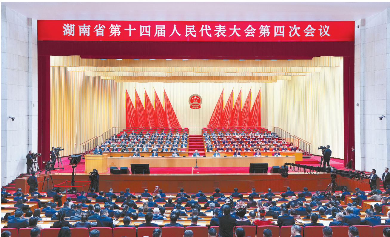
2月3日上午,湖南省第十四届人民代表大会第四次会议在省人民会堂开幕。