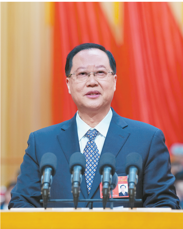
省长毛伟明作政府工作报告。