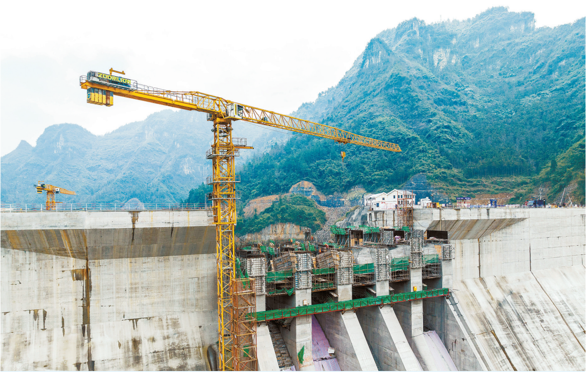
▲1月22日，吉首市矮寨镇大兴寨水库工程建设现场，工人正在进行溢流坝段浇筑作业。面对近期低温雨雪冰冻天气，建设单位采取保温措施并优化施工安排，确保工程按计划推进。

湖南日报1月22日讯（全媒体记者 王晗 通讯员 高涵 周沁怡）今天，2026年国家新一代自主安全计算系统产业集群工作推进会在长沙召开。会上，国链安全可靠计算机产业促进中心与飞腾信息技术有限公司签署合作协议，标志着湖南省新一代自主安全计算制造业创新中心（以下简称“创新中心”）揭牌成立，为湖南打造全国信创产业高地注入新动能。 近年来，湖南将绿色智能计算产业作为培育发展新质生产力的重要抓手，计划到2030年产业规模达2万亿元。目前，全省自主安全计算产业已集聚1400余家企业，2025年产值突破2300亿元，成功晋级国家级先进制造业集群。 作为产业升级的重要载体，创新中心将以争创国家级先进制造业创新中心为主要目标，依托“两芯一生态”技术路线，聚焦省内信创业务场景与行业应用市场，围绕数字化转型、信息系统集成、行业专用计算终端等核心业务，深化CPU、操作系统、整机等基础软硬件应用研发。 技术攻关层面，创新中心将重点破解自主安全计算领域共性关键技术瓶颈，适配AI+时代算力需求，抢占行业技术话语权；成果转化层面，加速产品适配测试与认证，推动集群产品在党政、金融、教育等场景规模化落地，打造示范标杆；生态培育层面，提升国产CPU技术路线渗透率，构建完善的本地信创生态。