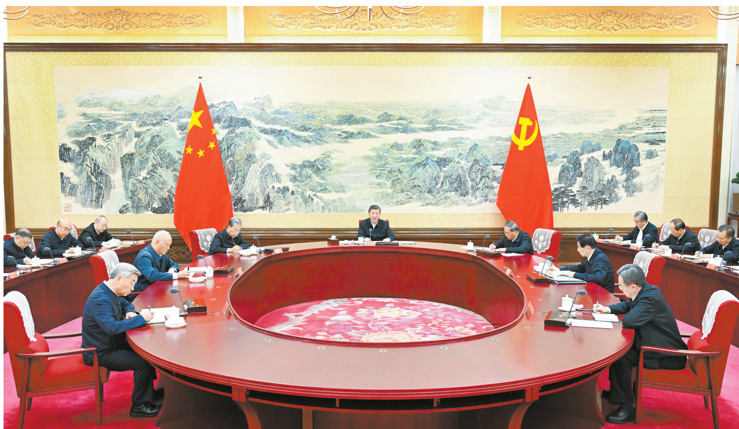
12月25日至26日，中共中央政治局召开民主生活会，中共中央总书记习近平主持会议并发表重要讲话。

新华社北京12月26日电 中共中央政治局于12月25日至26日召开民主生活会，深入学习贯彻习近平新时代中国特色社会主义思想，全面贯彻落实党的二十届四中全会精神，围绕锲而不舍落实中央八项规定精神，推进作风建设常态化长效化，结合思想和工作实际进行自我检视、党性分析，开展批评和自我批评。