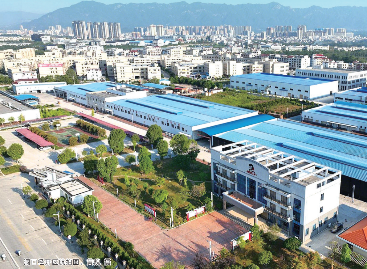
洞口经开区航拍图。