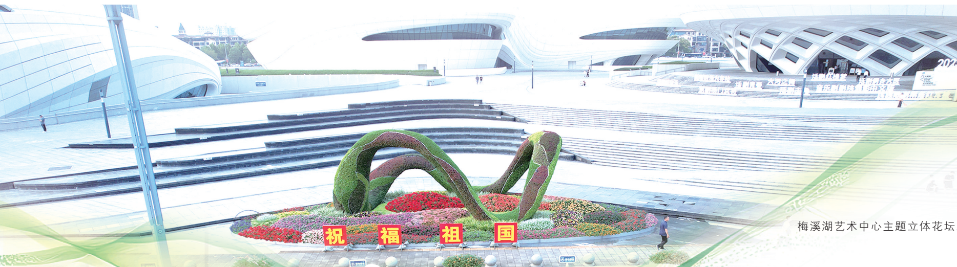
梅溪湖艺术中心主题立体花坛。