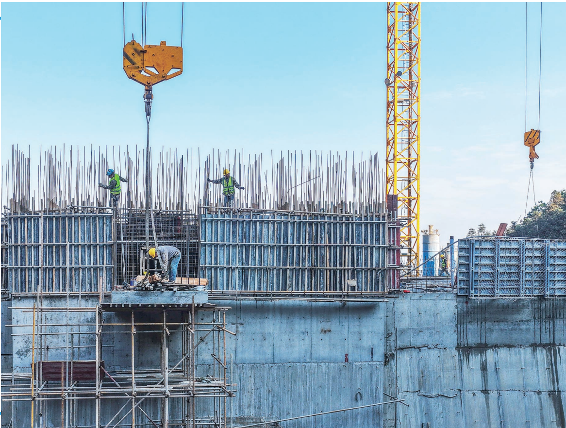
右图：12月15日，道县寿雁镇深田村，千里水库建设现场一派繁忙。该水库总库容139.2万立方米，建成后可保障7142亩农田灌溉及人畜饮水需求。