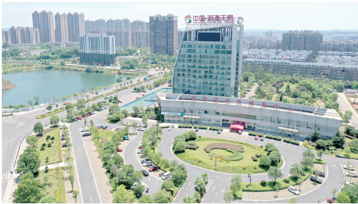
欣欣向荣的天易经开区局部。

“加强纪律建设没有完成时，全面从严治党永远在路上。”天易经开区主要负责人坚定表示，将继续保持战略定力，把严的基调、严的措施、严的氛围长期坚持下去，不断巩固拓展“以案三促”成果，以更加风清气正的政治生态，激发更加磅礴澎湃的发展动能，奋力书写园区高质量发展更加辉煌灿烂的新篇章。