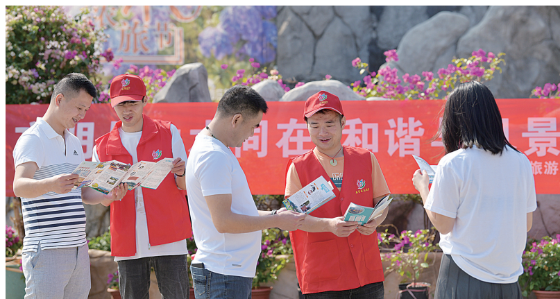
志愿者开展文明宣讲。