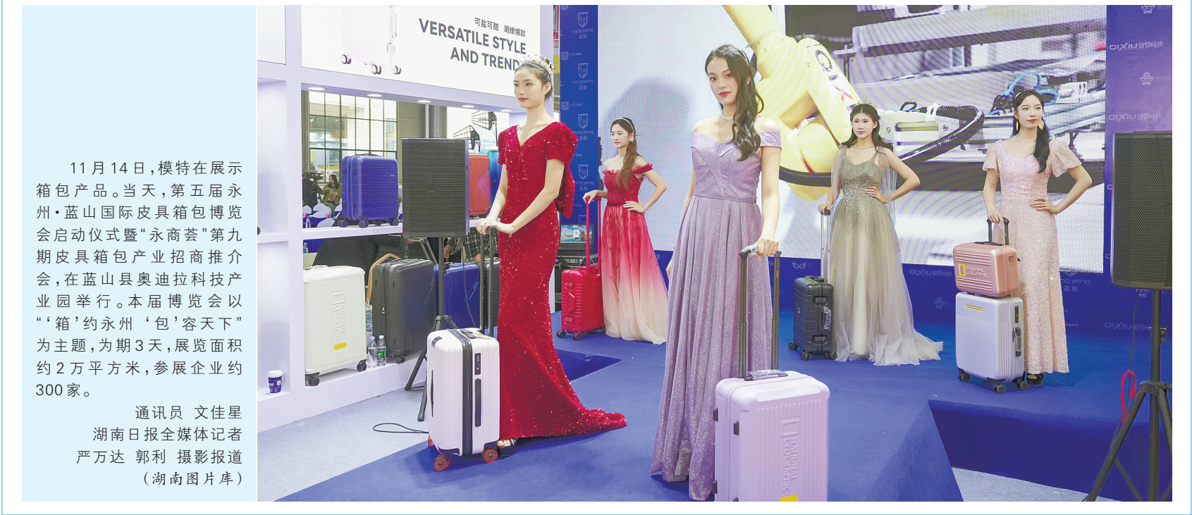
通讯员 文佳星 湖南日报全媒体记者 严万达 郭利 摄影报道 (湖南图片库)

全力守护人民群众生活安宁。聚焦近年来多发的电信诈骗犯罪，全省公安机关加强大要案件全链条侦办攻坚，按照大要案件侦办“三定五清”标准，查清境外窝点、查清窝点人员身份，力争实现案件全链条打击。推进案件打击向境外延伸，加大案件研判侦办力度，通过国际协作到境外开展打击。