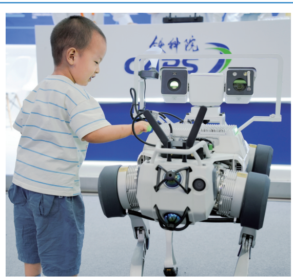
9月14日,2025年中国国际服务贸易交易会在北京落下帷幕。图为当日,小朋友在环境服务专题展区与机器狗互动。

据新华社北京9月14日电 金秋时节,东海之滨,甬舟铁路全线控制性工程金塘海底隧道建设现场机械轰鸣。来自中铁十四局的建设者抢抓工期进度,全力推进隧道进口端掘进施工。金塘海底隧道全长16.18公里,最大埋深达78米,是世界最长的海底高铁隧道。