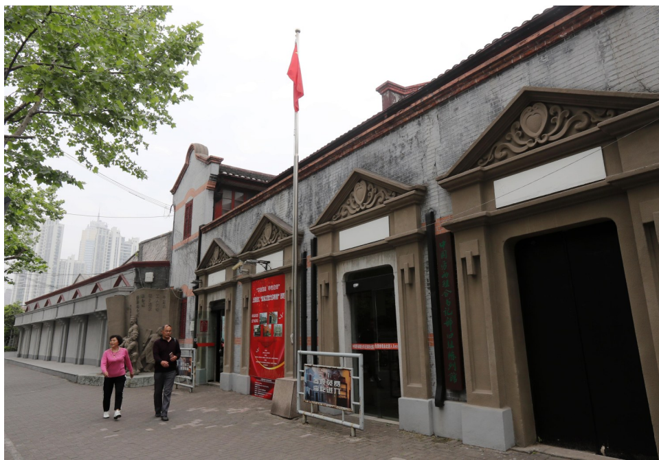
图为中国劳动组合书记部旧址陈列馆外景。(资料照片)