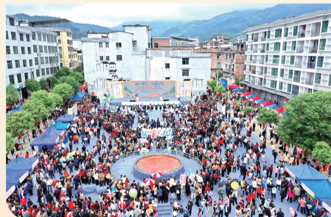
桂东县首届“村厨大赛”现场。

“以味为引、以旅为媒”。桂东将以首届村厨大赛为引,陆续打造“茶香寻味之旅”“乡村食韵之旅”“养生山珍之旅”三条美食文旅之路,展示“绿水青山就是金山银山”的生动实践成果。(罗徽 郭建东)