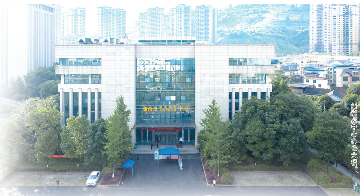
湘西州公共资源交易中心大楼。

2015年4月28日,湘西州政府印发《湘西土家族苗族自治州公共资源交易中心主要职责内设机构和人员编制规定》,标志着湘西州公共资源交易中心正式成立。十年来,该中心应改革而生,与创新同频,矢志铸造统一规范、公开透明、服务高效的交易平台,先后获评省文明单位、省文明窗口单位、州直党建示范点、州平安单位、州民族团结进步创建示范单位、州级清廉机关建设示范点等,累计完成交易项目12622个,交易总金额突破2110.89亿元,溢价和节约资金超96.45亿元,为湘西州经济社会高质量发展注入强劲动能。