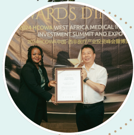
荣获2024 HCOWA中国—西非医博会最佳品牌奖和杰出慈善奖。

中医药文化是中华民族的瑰宝，是居民健康预防、科学调养的重要举措。作为一家知名的中医互联网医院企业，谷医堂积极弘扬中医药文化，通过爱心义诊、打造中医药文化科普电视栏目、出版中医药文化书籍、打造新媒体科普宣传矩阵等方式，向全社会广泛开展健康知识的普及与中医药传统国粹文化的弘扬。