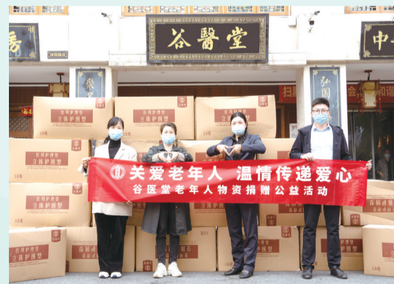
谷医堂老年人物资捐赠活动。