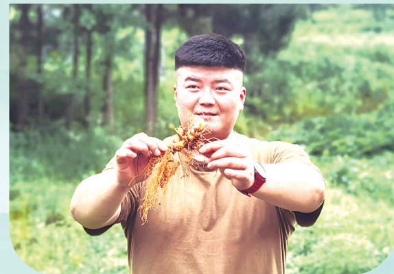
走进原产地。