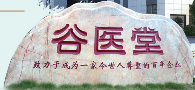
“致力于成为一家令世人尊重的百年企业”