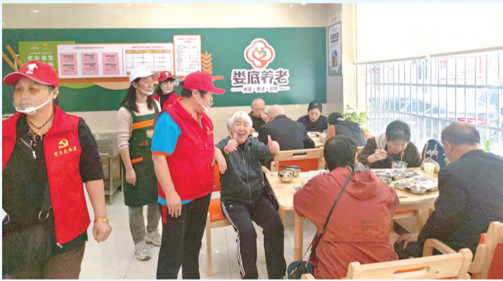
娄星区长春社区老年食堂获群众点赞。

“向阳花”行动,护航亲子共成长。2024年,省财政安排1520万元支持开展家庭教育指导服务“向阳花”行动,并首次纳入湖南省重点民生实事,“向阳花”行动线下指导服务市场火爆,惠及家长430余万人。