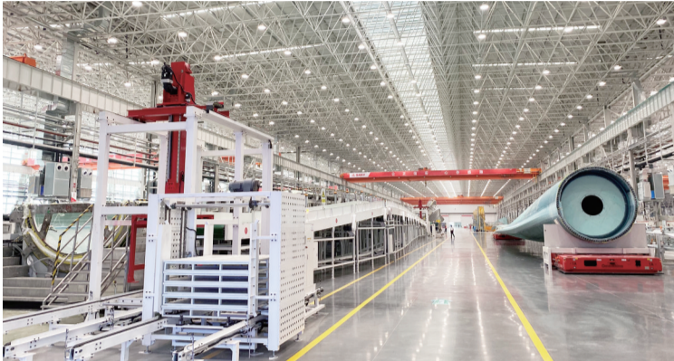
韶山三一重能叶片工厂入选全球第一批“灯塔工厂”。

在市委、市政府的领导下,韶山高新区凭借“闯”的精神、“创”的劲头、“干”的作风,坚持改革创新,致力于“五好园区”建设,探索出特色产业园区的“韶山高新模式”,跑出了高质量发展的“韶山高新速度”。预计全年实现技工贸收入200亿元、规模以上工业总产值175.2亿元、固定资产投资62.3亿元,同比分别增长8%、8.5%、22%,预计全年完成税收7.4亿元,同比增长5%,亩均税收可达15.7万元。