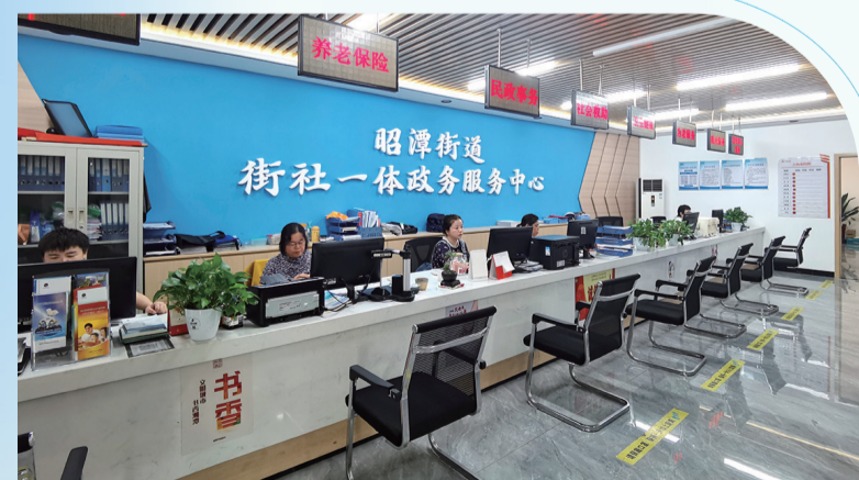
雨湖区昭潭街道街社一体政务服务中心。

2025年是实施“十四五”规划的收官之年，也是谋划“十五五”规划之年。站在新的起点上，雨湖区将深入学习贯彻党的二十届三中全会精神，在党中央和省、市的坚强领导下，团结带领全区人民，以更加饱满的热情、更加务实的作风、更加有力的举措，奋力开创雨湖高质量发展新局面，让“身在雨湖·感受幸福”成为最动人的现实普遍情景。