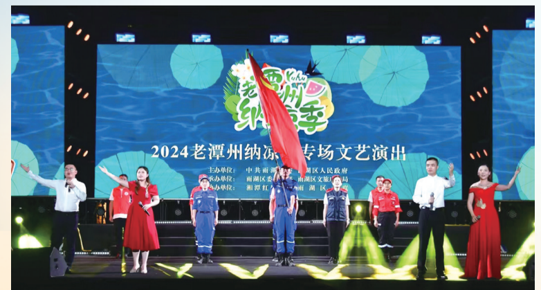
2024老潭州纳凉季系列活动精彩上演。