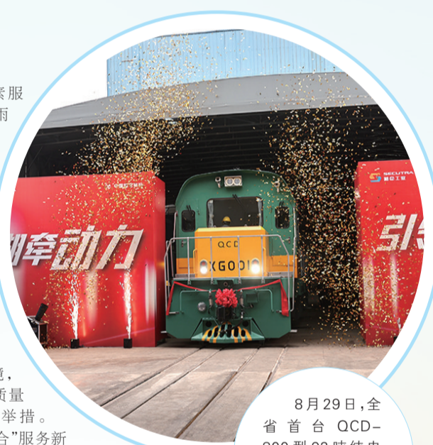
8月29日，全省首台QCD-800型92吨纯电动机车在湖南湘牵工业有限公司下线。

金链、人才链深度融合，不断完善产业链条、壮大产业集群、优化产业生态，持续提升发展的含“新”量、含“绿”量、含“金”量。