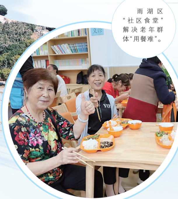
雨湖区“社区食堂”解决老年群体“用餐难”。

项目建设高歌猛进，产业转型成果丰硕，经济发展活力满满。未来，雨湖区将进一步推动创新链、产业链、资