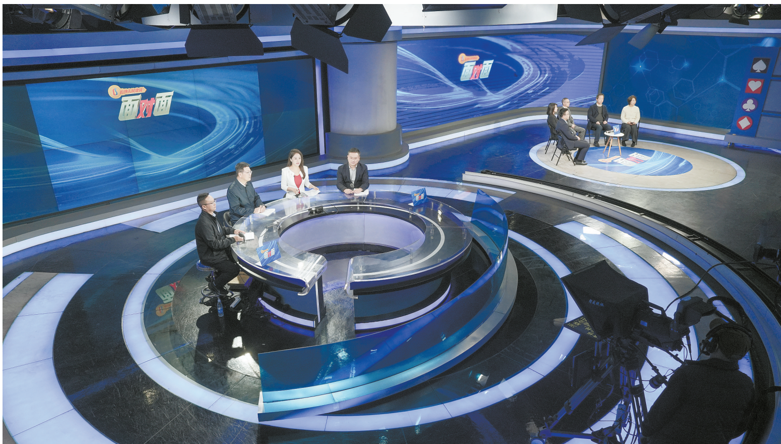
11月24日,长沙人民建议“面对面”节目正在录制。

今年以来,湖南各地积极开展人民建议征集工作,将“问需于民、问计于民、问效于民”的理念贯穿于社会治理全过程,各类人民建议征集活动有声有色,一大批关键小事、民生实事、发展大事得以办实办好。