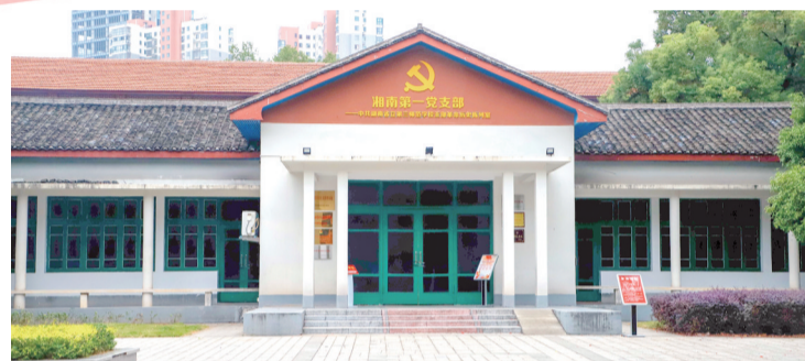
湘南革命的摇篮：“湘南第一党支部”——中共湖南省立第三师范学校支部革命历史陈列室。