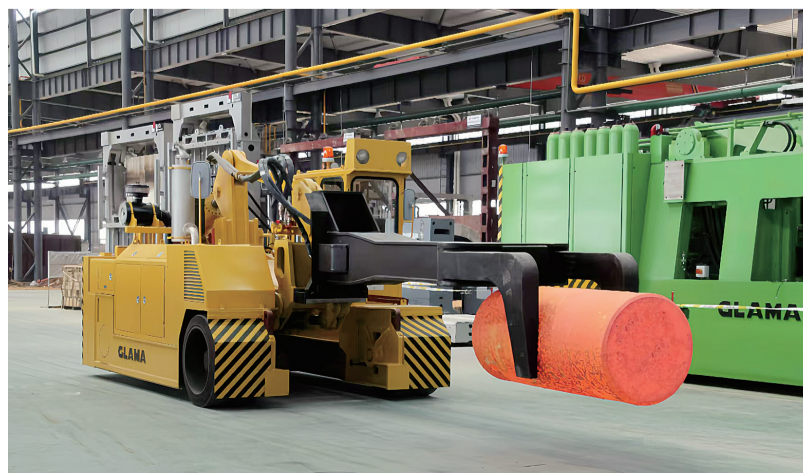
金天钛业生产线。