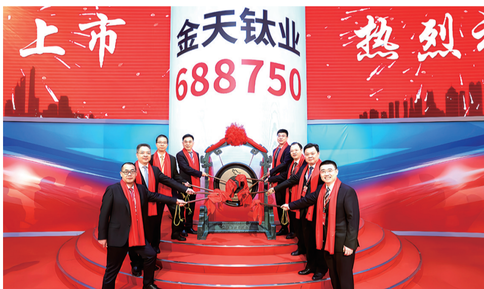
金天钛业首次公开发行A股上市仪式。

依托在高端钛合金材料领域的技术优势,金天钛业紧紧围绕国家战略,承担多项国家重点型号装备关键材料的研制生产任务,树立起钛及钛合金棒材、锻坯及零部件主导产品,主要应用于航空、航天、舰船及兵器等高端装备领域。