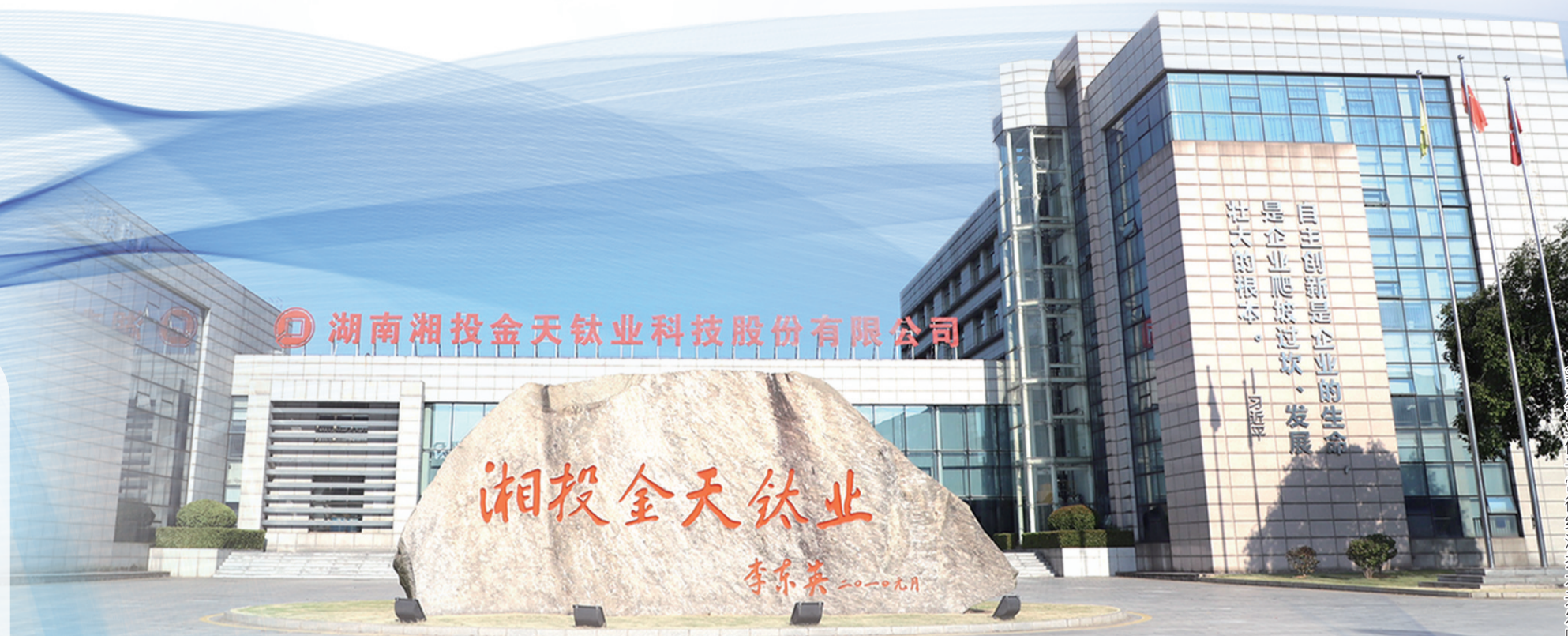
湖南湘投金天钛业科技股份有限公司