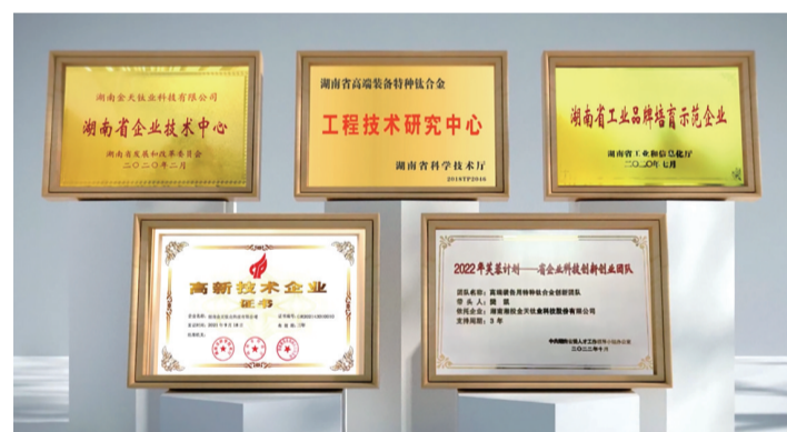
金天钛业是国家级专精特新“小巨人”企业,获得各类专利近70余项,图为部分奖牌。

目前,金天钛业成功研制与批量交付近20个牌号钛合金材料及多个零部件,其中多个产品填补国内空白。“湘”字号钛材进入“国家队”行列,有力支撑了我国国防装备的升级换代,保障了我国国防装备关键材料的供应。