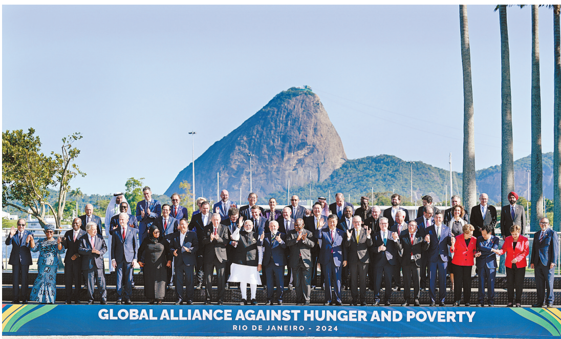
当地时间11月18日上午,国家主席习近平在巴西里约热内卢出席二十国集团领导人第十九次峰会。峰会把“构建公正的世界和可持续的星球”作为主题,并决定成立“抗击饥饿与贫困全球联盟”。这是习近平同与会领导人共同参加巴方发起的“抗击饥饿与贫困全球联盟”合影。