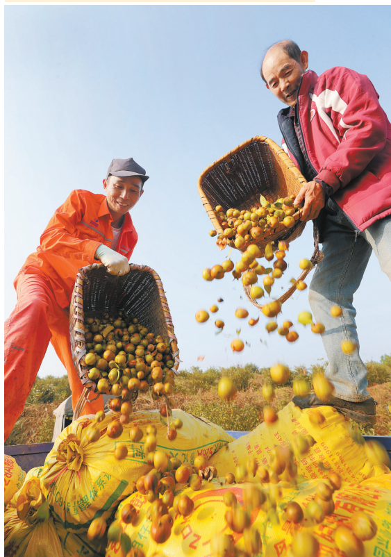
左图:11月3日，衡东县高湖镇，村民将采摘的油茶果集中装车。金秋时节，该县种植的油茶成熟，村民趁着晴好天气抓紧采摘、晾晒油茶果，确保丰收。近年来，衡东县采取“公司+基地+农户”模式，大力发展油茶产业，带动村民增收致富。