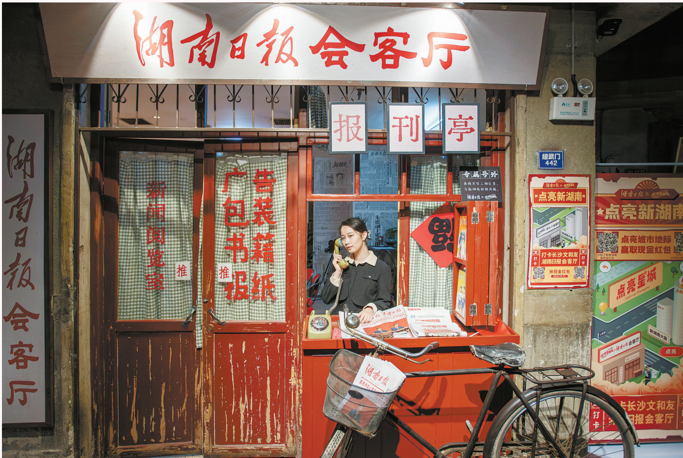
10月21日，游客在“湖南日报会客厅”拍照打卡。