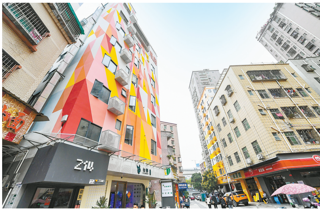
在深圳市龙华区元芬村拍摄的改造后的青年公寓外立面(左)。(资料照片)

17日，住房城乡建设部、财政部、自然资源部、中国人民银行、国家金融监督管理总局五部门有关负责人齐聚新闻发布会，推出增量举措，落实存量政策，打出一套组合拳，推动房地产市场止跌回稳。新举措将对房地产市场产生哪些影响？