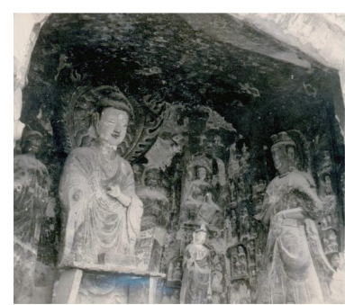
广元千佛崖大佛洞 旧貌