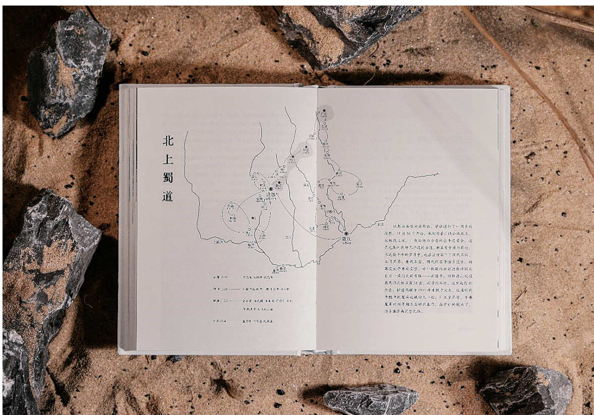
《漫长的调查》实拍书影。

学社团队到川康两省展开野外考察期间，我们曾收到过父亲的来信，厚厚的一沓。那是十多张“考察连环画”，画面上他们走在郁郁葱葱的山林之间，脚夫们手上抬着滑竿，嘴里喊着号子。脚夫通常两个人抬滑竿，一前一后，后面的人看不见前路，全靠与走在前面的脚夫对话来