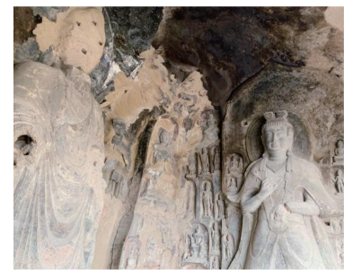
广元千佛崖大佛洞 现状