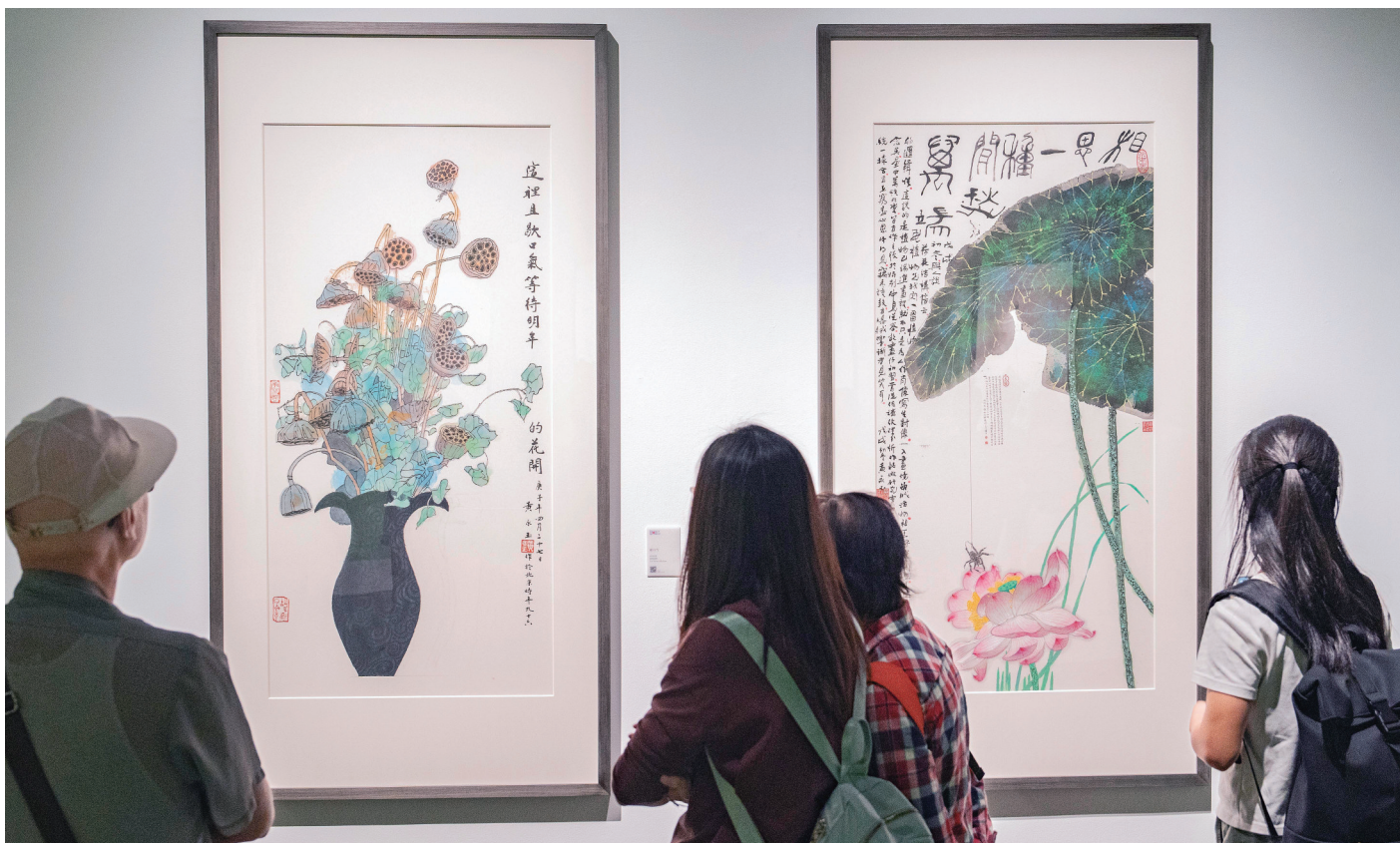
10月2日，湖南美术馆，观众在欣赏“如此漫长·如此浓郁——黄永玉新作展”。

受到木刻影响及湘西民间美术的熏陶，黄永玉偏好浓烈、对比强的色彩。他以鲜明的色彩搭配，塑造出一个个天真稚拙、生趣盎然的形象。