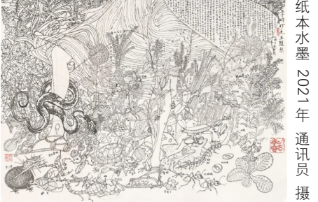
黄永玉作品《李时珍先生随想》179x97cm 纸本水墨 2021年

在百岁的门槛上，他或许已提着他少时的行囊远走了。但在艺术与文学的世界，他生命的光华了，他挽留下的美，长留着。比百岁，还要长很多很多。