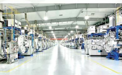
株硬型材分公司烧结大厅长。

与党同心、与国同行、与时代同步。岁月流金，溢彩华光，迎来70华诞的株硬集团，正稳步朝世界一流迈进。