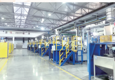
株硬粉末事业部中粗碳化钨粉智能生产线。