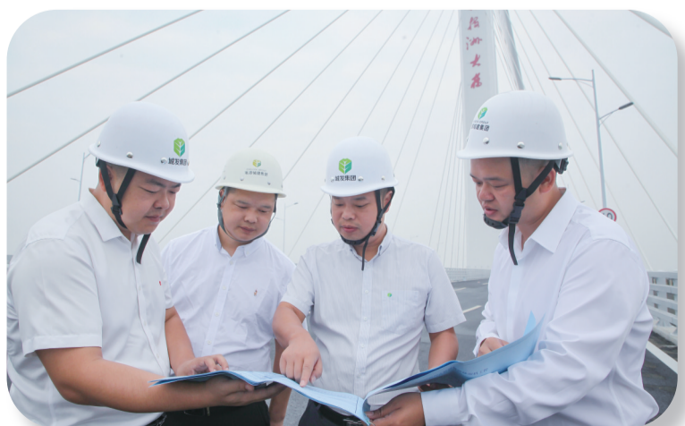
驻杨梅洲大桥项目工作人员核对施工图。