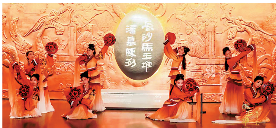
《马王堆·岁月不朽》画面。