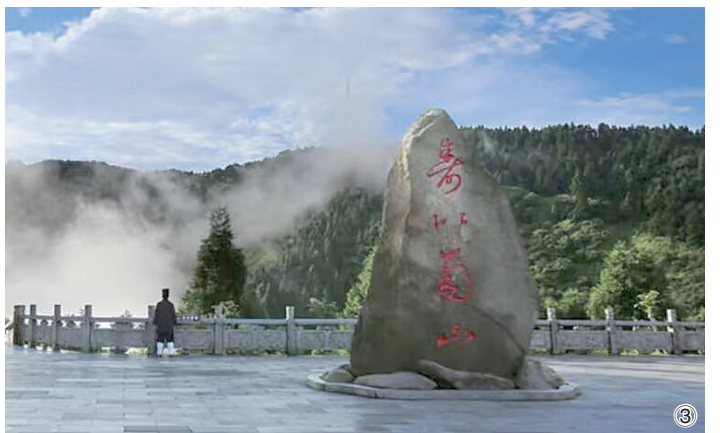
图①石鼓书院。 图②宋徽宗寿岳石刻。 图③“寿比南山”石刻。