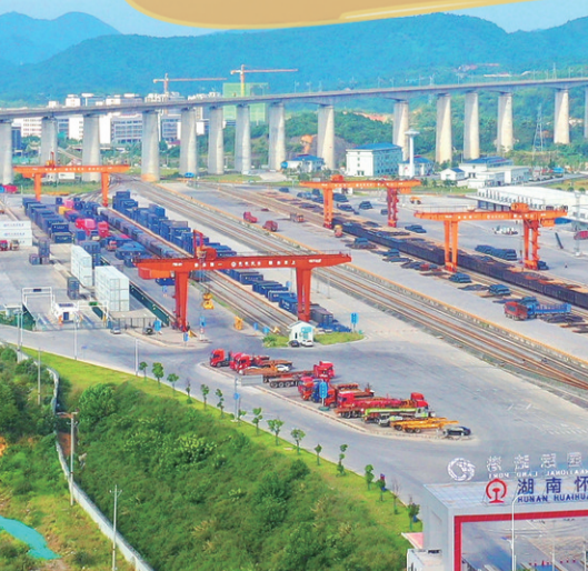
怀化国际陆港主港区。

第十一届全球湘商大会召开在即，怀化国际陆港经开区在市委、市政府的领导下，将继续以“构建大平台，打通大通道；开展大合作，深化大通关；聚焦大产业，做优大环境”的高质量发展态势，以“依托双通道、对接两大洋、服务双循环”的高水平对外开放格局，向全球客商敞开怀抱。