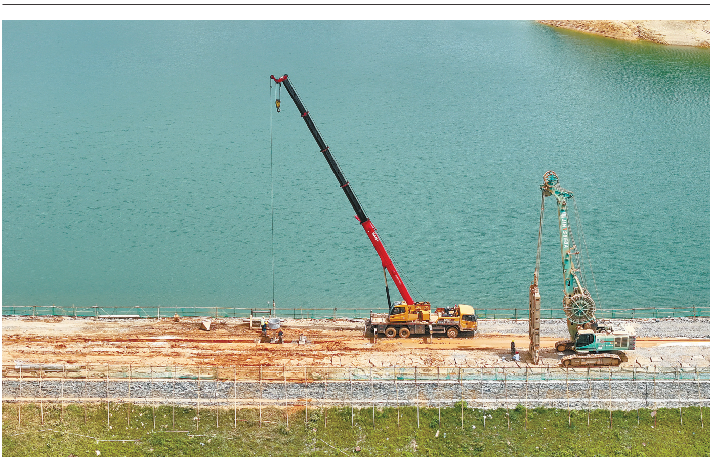
9月6日，郴州市苏仙区高峰水库除险加固工程稳步推进中。连日来，苏仙区抢抓施工黄金期加快建设，全面提升水库蓄水、防洪、灌溉能力，保障水库安全运行和效益发挥。

抵制违规托管，共同营造良好环境。如发现校外托管机构存在未办理营业执照、未办理食品经营许可证提供餐饮服务、未办理消防验收(备案)、一次性收费超过3个月、开展文化教育培训、提供过夜住宿服务、聘用有违法犯罪记录的工作人员和其他违法违规行为，可向属地有关部门或拨打12345投诉举报。