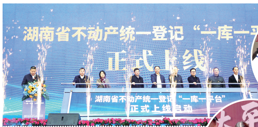
2023年3月，湖南省不动产登记“一库一平台”上线启动仪式在益阳举行。