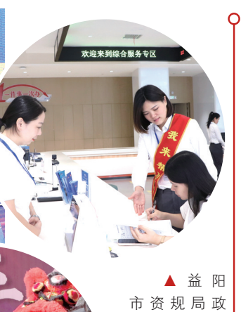
益阳市资规局政务服务窗口的服务周到、细致。