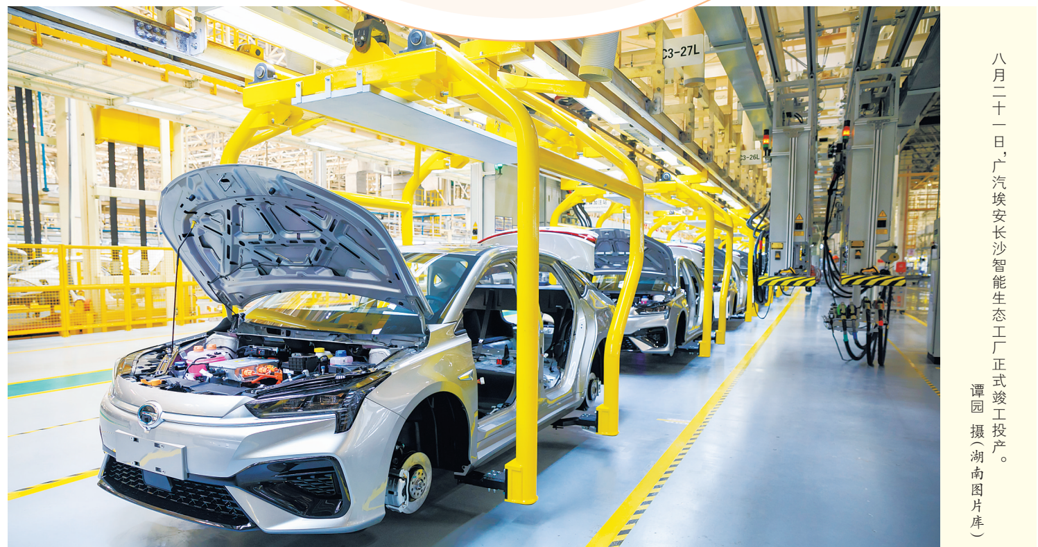
八月二十一日,广汽埃安长沙智能生态工厂正式竣工投产。