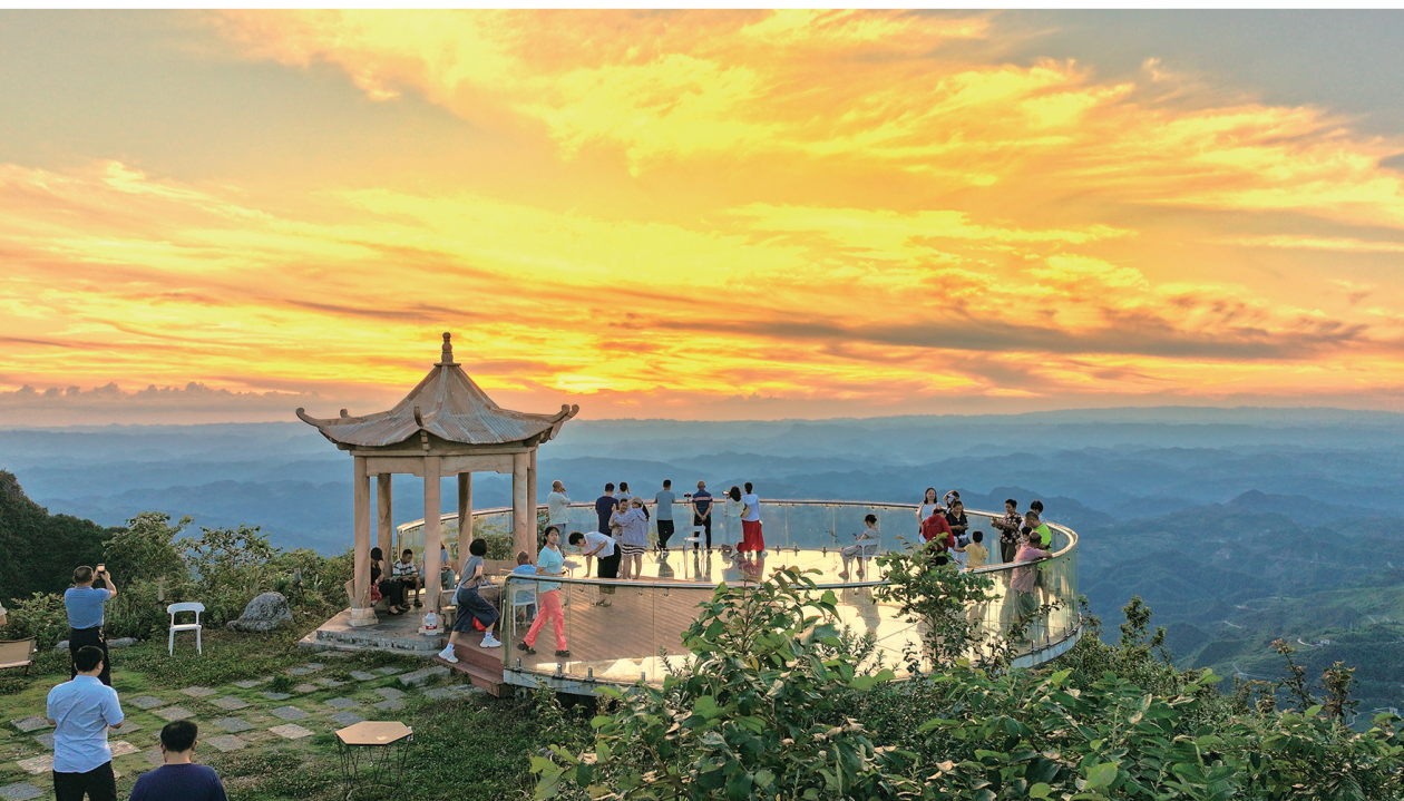
八面山山顶观景台,游客纷纷拿起手机记录美景。