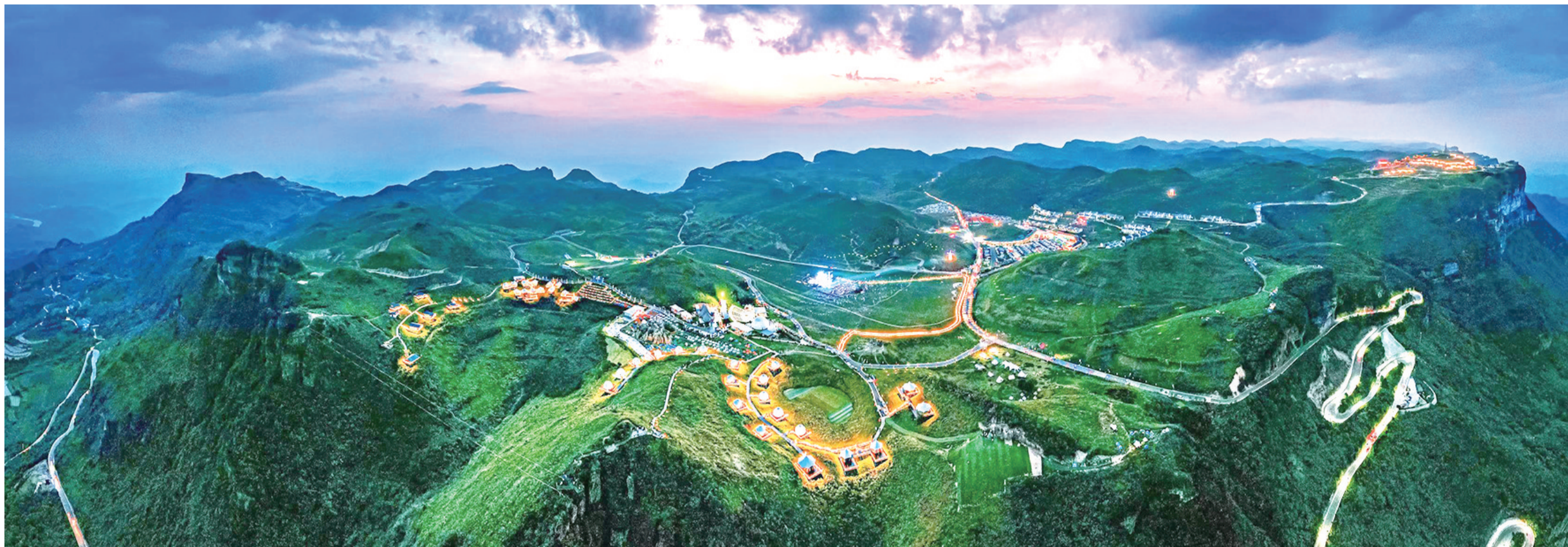
八面山景区平均海拔1200多米,夏季平均气温只有20多摄氏度,景点众多、神奇壮观,正是休闲、避暑、康养好去处。