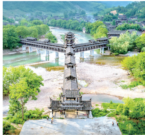
惹巴拉土家凉亭桥。