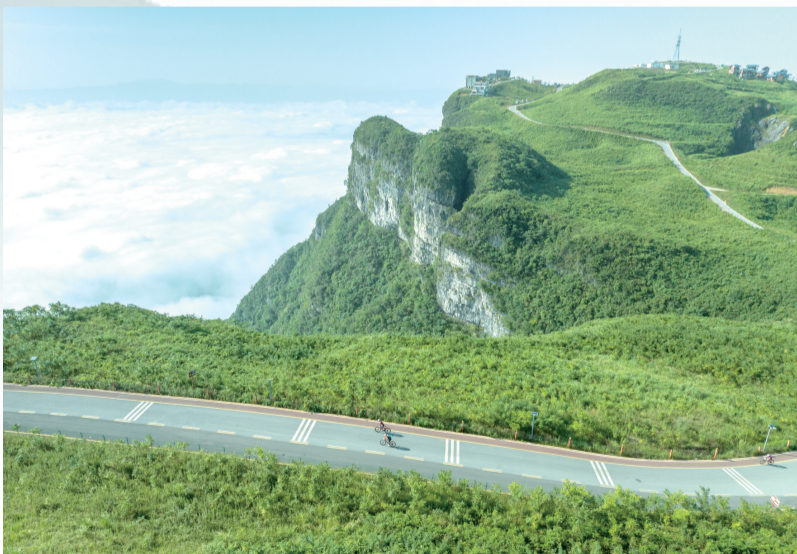
8月12日,2024“大美湘西·云端上的骑行”自行车邀请赛爬坡赛在里耶镇举行。