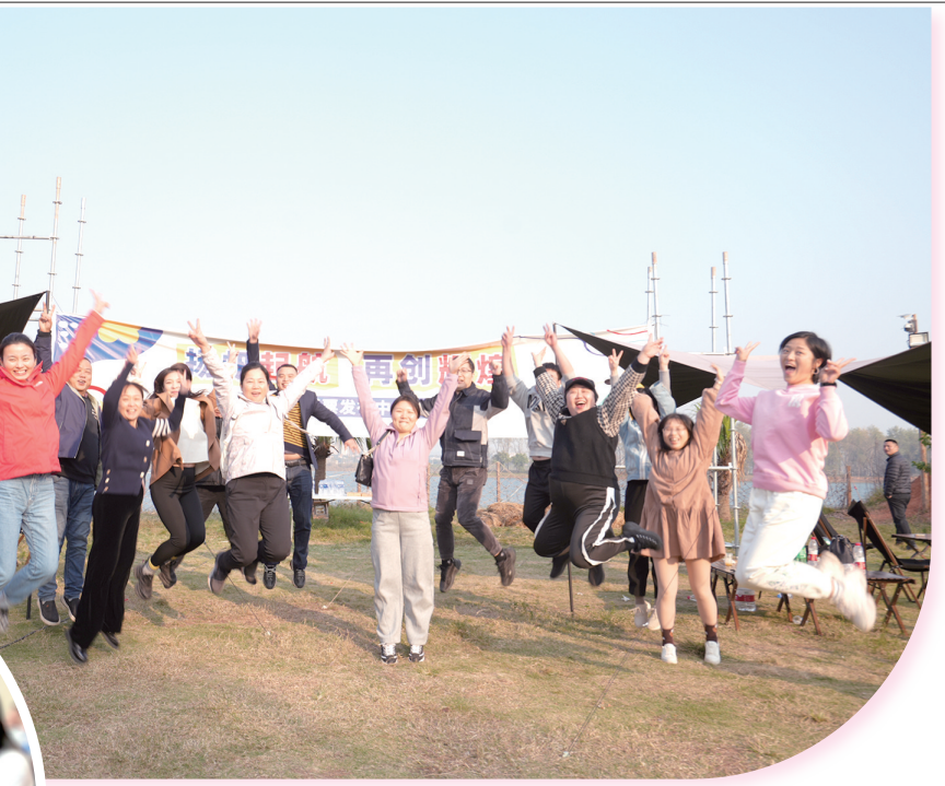
省福彩中心组织“扬帆起航 再创辉煌”主题团建活动。

严格政府采购。2023年,湖南福彩建立健全政府采购全过程制度管理体系,修订完善电子卖场采购实施办法、政府采购实施办法、规范采购合同及履约验收实施办法等,建立“预采协同、监采全程”的闭环管理机制,省中心全年完成年度政府采购项目14项,完成电子卖场采购订单160个,做到符合政府采购限额标准应采尽采,占比100%。同时,加强对供应商的责任管理,进行不定期检查,促进供应商履责。